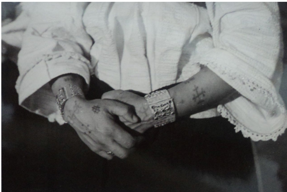
Zemaljski muzej Bosne i Hercegovine. Inv. Br. 361. Tetoviranje ruke, okolina Travnika.