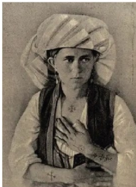
GZM BiH, god. 1, knj. III, juli-septembar, 1889, str. 88.