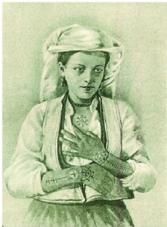
GZM BiH, god. 1, knj. III, juli-septembar, 1889, str. 81.