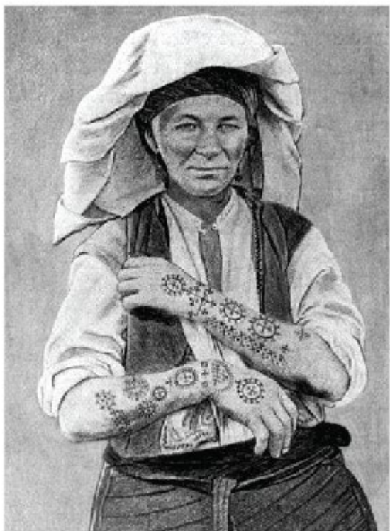
GZM BiH, god. 6, knj. II, april-juni, 1894, str. 243.