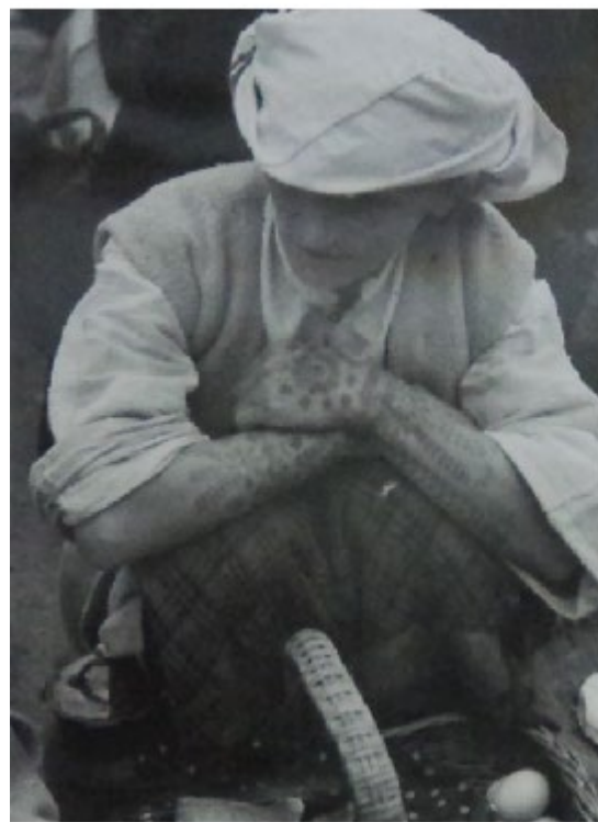
Zemaljski muzej Bosne i Hercegovine. Inv. Br. 361. Tetoviranje ruke, okolina Travnika.