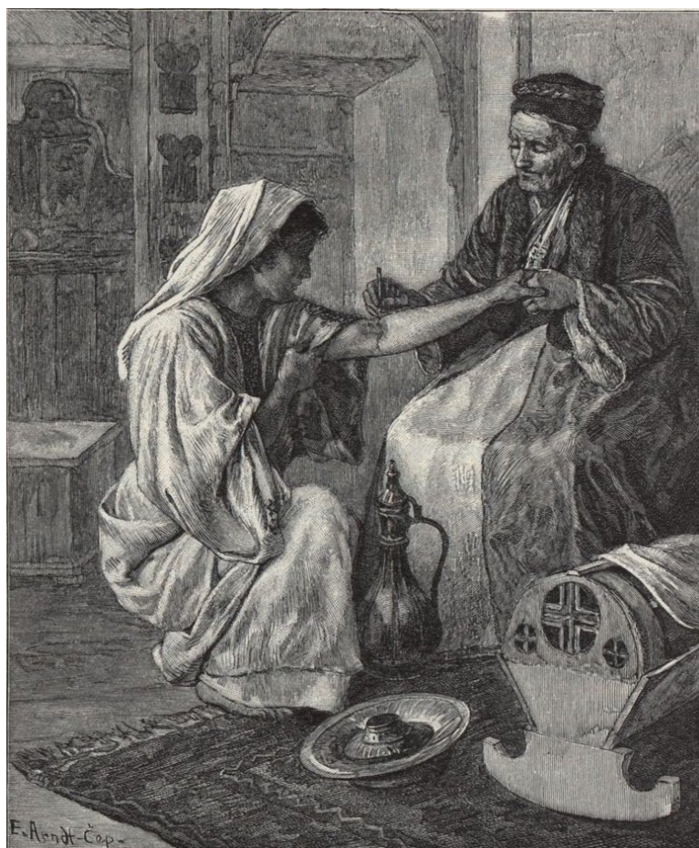
Die österreichisch-ungarische Monarchie in Wort und Bild. Bosnien und Hercegovina, str. 341. Autor: Ewald Arndt-Čeplin.